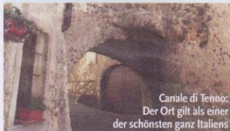
Canale di Tenno: Der Ort gilt als einer der schönsten ganz Italiens

Tags darauf geht es in unberührte Natur zum Tenno See, dessen intensives variationsreiches Grün einfach unbeschreiblich ist. Ganz nahe liegt das älteste mittelalterliche Dorf der Gegend, Canale di Tenno. Einst fast verlassen, haben sich