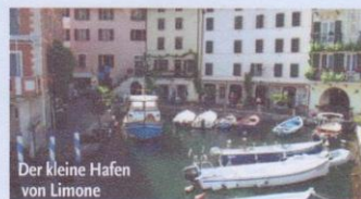
Der kleine Hafen von Limone