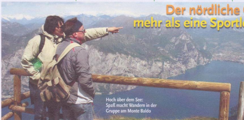
Hoch über dem See: Spaß macht Wandern in der Gruppe am Monte Baldo

Der nördliche Gardasee ist ein wahres Mekka, wenn es um Surfen, Biken und Klettern geht. Viele bunte Segel huschen über das glitzernde Wasser, sportliche Trikots zieren den Straßenrand und die Bergfäde, atemberaubend hängen die Kletterer in den Felswänden. Aber da gibt es so viel mehr zu entdecken, wo man sicher kein Hochleistungssportler sein muss