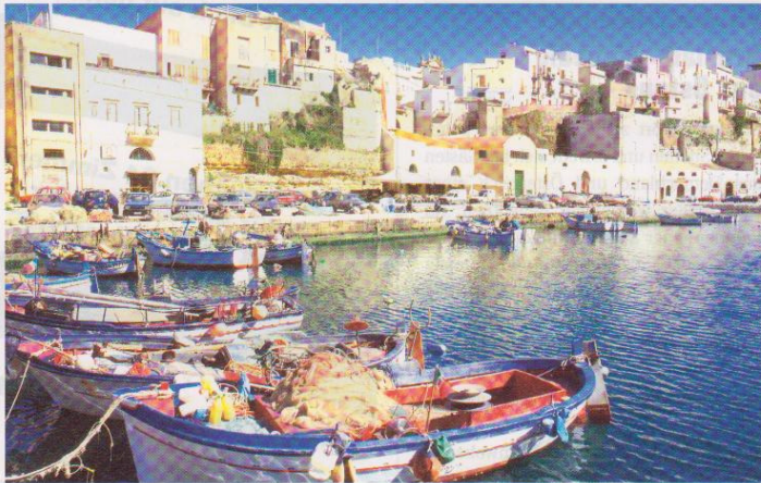
Sizilien mit Michelangelo International Travel, Ägypten mit H&amp;H Tur