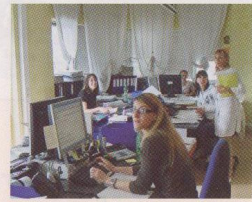
Im Büro von MIT in Riva del Garda werden die Programme erstellt.

Doch was wäre der Gardasee ohne Limone? Ein bisschen (Agri-)Kultur muss ja auch sein beim Wandern oder Rad fahren. Wir nähern uns mit dem Schiff von der anderen Uferseite