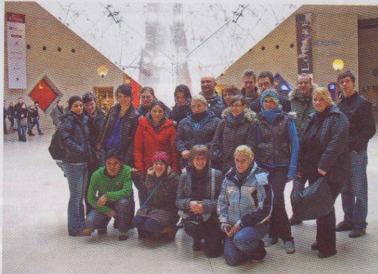
Nachwuchsförderung von Azubis steht beim Soester Paketer BBT im Mittelpunkt

„Bonjour Paris“, hieß es für 21 Azubis von Busreiseunternehmen und Reisebüros im Rahmen der „eday on tour“-Aktion des Soester