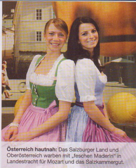
Österreich hautnah: Das Salzburger Land und Oberösterreich warben mit „feschen Maderln“ in Landestracht für Mozart und das Salzkammergut.