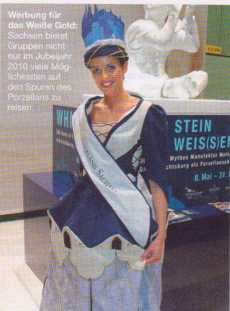
Werbung für das Weiße Gold: Sachsen bietet Gruppen nicht nur im Jubiläum 2010 viele Möglichkeiten auf den Spuren des Porzellans zu reisen.